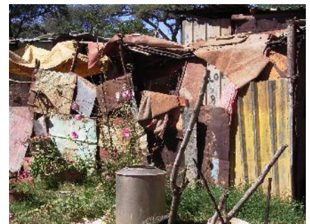
Eine Unterkunft in Dordabis

beitslosigkeit und deren Auswirkungen geprägt. Dordabis ist Namibia im Kleinen. Die Kluft zwischen Arm und Reich, die auf nationaler Ebene für Schlagzeilen sorgt und Namibia einen traurig berühmten Platz in der Umverteilungsskala beschert, ist auch in Dordabis und Umgebung zu beobachten. Die großen Farmen um Dordabis herum kontrastieren durch ihre Größe und ihre Infrastruktur mit der kleinen Fläche, auf der die 1000 Einwohner von Dordabis ihr Leben verbringen, ohne Zugang zu Wasser, Land und Strom, ohne Arbeitsmöglichkeiten und ohne sicheres Einkommen. Dordabis Probleme sind zu gewaltig, um im Rahmen einer Partnerschaft auf Gemeindeebene gelöst zu werden. Was hier dringend benötigt wird, ist eine systemische und strukturelle Intervention, die nachhaltige Lösungen zu folgenden Problemen bringt: Zugang zu Land, Wasser und Ausbildungsmöglichkeiten in der Landwirtschaft, für diejenigen, die in diesem Sektor tätig werden wollen, sagte einer unserer Gesprächspartner.