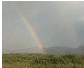
Zeichen der Hoffnung über Namibia

Philosophie von Gleichheit und einer Theologie der Würde basiert.