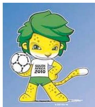
Zakumi, Maskottchen für 2010