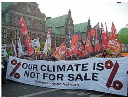
Attac in Kopenhagen

Die Verhandlungen im Vorfeld gaben keinen Anlass zum Jubel. Im Gegenteil verleiteten die aus den Verhandlungskreisen wahrgenommenen Signale zur Annahme, dass nur Katastrophen großen Ausmaßes die Staatengemeinschaft dazu bewegen würden, sich von der Logik des Minimalkonsenses in Klimafragen zu verabschieden, um sich auf die radikale Neuorientierung einzustellen, die die Situation jetzt schon verlangt. Dieses fatalistische Denken klingt absurd, aber es entspricht der Wirklichkeit. Warum würde es die internationale Gemeinschaft zu großen Katastrophen kommen lassen, wenn sie doch noch Handlungsspielraum hat?