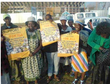
Streetnet: world class cities for all

Neben diesen wirtschaftlichen Folgen sind für die Bevölkerung jedoch gerade gesellschaftliche und soziale Auswirkungen von Bedeutung. Und in diesem Hinblick haben die Vorbereitungen der WM bisher für viele Menschen Nachteile bedeutet. In der Kritik steht beispielsweise die Zerstörung des Early Morning Market an der Warwick Junction in Durban. Der seit nunmehr fast 100 Jahren existierende Markt soll Platz für eine Shopping-Mall machen. Nur 150 der etwa 650 seit Jahren ansässigen Händler werden in dem neuen Einkaufscenter weiterhin verkaufen können.