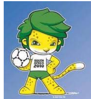
Zakumi leitet sich aus dem Ländercode ZA für Südafrika und dem Wort kumi ab, welches in mehreren südafrikanischen Sprachen die Zahl Zehn bedeutet.

Die Arbeitsbedingungen in der chinesischen Fabrik sind jedoch nicht der einzige Grund für die allgemeine Entrüstung. Mindestens genauso viel Empörung ruft die Tatsache hervor, dass die WM-Maskottchen