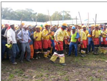
Bauarbeiter im Streik