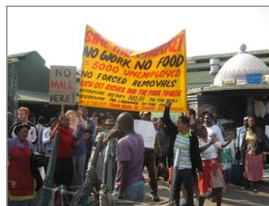
Durban, Warwick: Early morning market

denkenlos, wie oft dargestellt. Je näher die größte Sportparty der Welt rückt, desto deutlicher wird, dass sich hinter dem offiziellen Diskurs und der als allgemein dargestellten Begeisterung viele Probleme verbergen, die auf das Zelebrieren der afrikanischen Menschlichkeit dunkle Schatten werfen. Eines dieser Probleme heißt Zwangsumsiedlung.