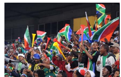
Bunte Vuvuzelas bestimmen das Bild in den Stadien

Viele SüdafrikanerInnen fragen sich inzwischen, warum die südafrikanische Regierung nicht den gleichen Ehrgeiz dabei entwickelt hat, ihren Pflichten gegenüber dem eigenen Volk genauso nachzukommen wie gegenüber den Forderungen der FIFA. Landesweit brechen immer wieder Proteste und Unruhen wegen fehlender „service delivery“, also dem Erbringen staatlicher Dienstleistungen wie Bildung, Gesundheit, Wohnungsbau aus. Gleichzeitig mehren sich Klagen über Korruption, das Elitendenken der Verantwortlichen und die zunehmende Verflechtung von Politik und Wirtschaft. Die vielen tausend Fußballfans müssen mit ansehen, wie aus ihrem geliebten Sport reiner Kommerz wird, dass sie an diesem so herbeigesehnten Ereignis aufgrund von Arbeitslosigkeit und hohen Ticketpreisen gar nicht teilhaben können. Was bleibt vom südafrikanischen Fußball-Erlebnis?